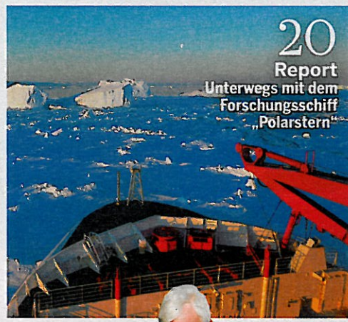
20 Report Unterwegs mit dem Forschungsschiff „Polarstern“