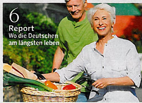
6 Report Wo die Deutschen am längsten leben