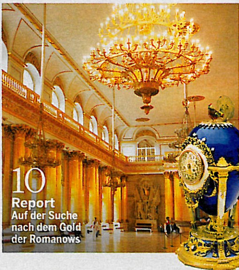
10 Report Auf der Suche nach dem Gold der Romanows