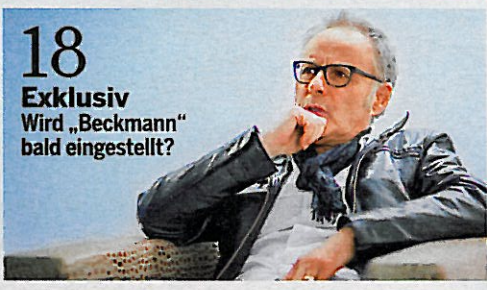
18 Exklusiv Wird „Beckmann“ bald eingestellt?